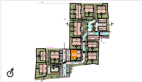
PLAN DE VENTE